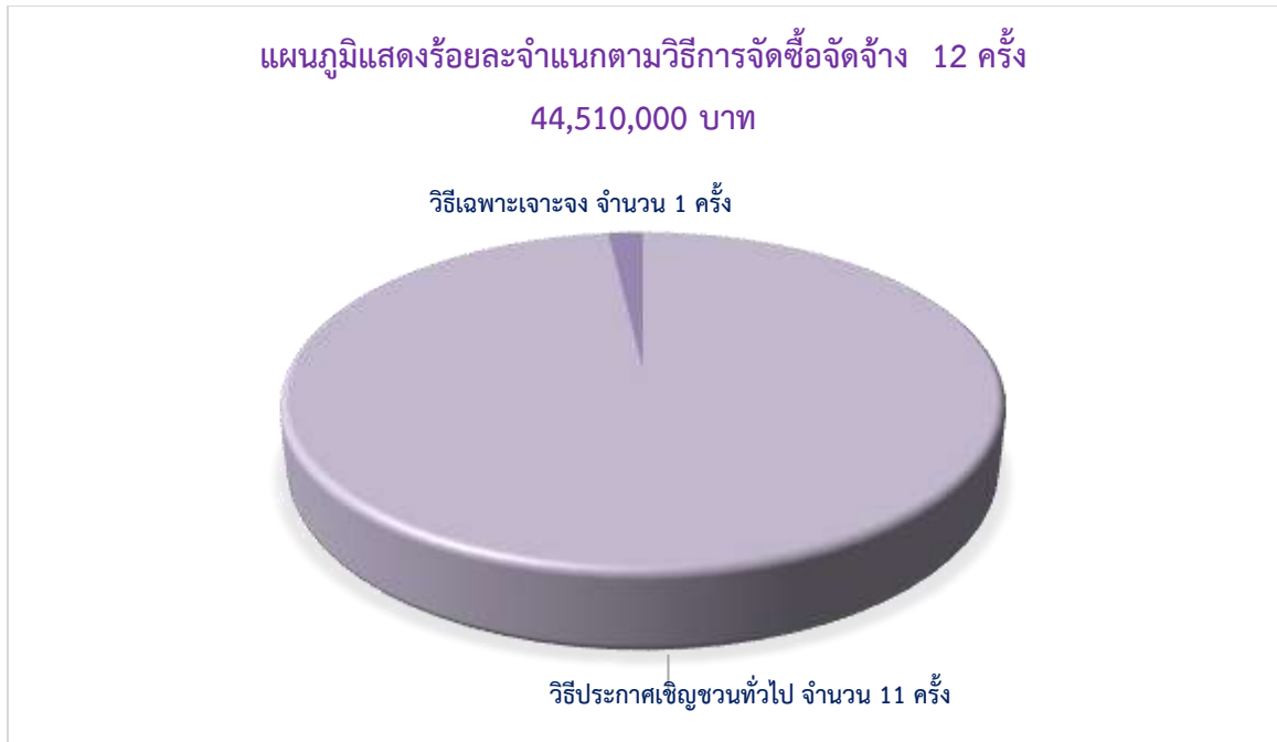
ตารางที่ ๒ แสดงร้อยละงบประมาณ จำแนกตามวิธีการจัดซื้อจัดจ้าง ประจำปีงบประมาณ พ.ศ. ๒๕๖๗