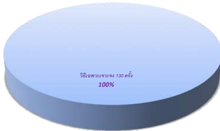
ตารางที่ ๒ แสดงร้อยละงบประมาณ จำแนกตามวิธีการจัดซื้อจัดจ้าง ประจำปีงบประมาณ พ.ศ. ๒๕๖๗